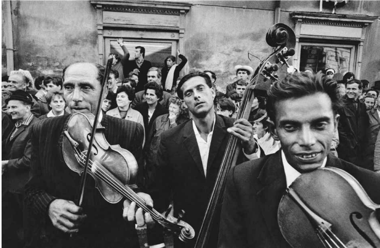
Josef Koudelka | Magnum Photos | Morava | Strážnice | 1966