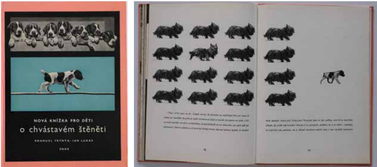
5. Jan Lukas (fotografie), Emanuel Fryntas (text/design), Nová knížka pro děti o chvátavém štěněti. Praha: Státní nakladatelství dětské knihy (SNDK) 1964. (Prvé vydanie v nemčine: Vom lügenhaften Hündchen. Praha: Artia 1962.)

Moderný život vo veľkomeste je aj predmetom knihy Ladislava Svatoša Hledej co najdeš ve městě (1959). Ide o robustné leprelo s farebnými