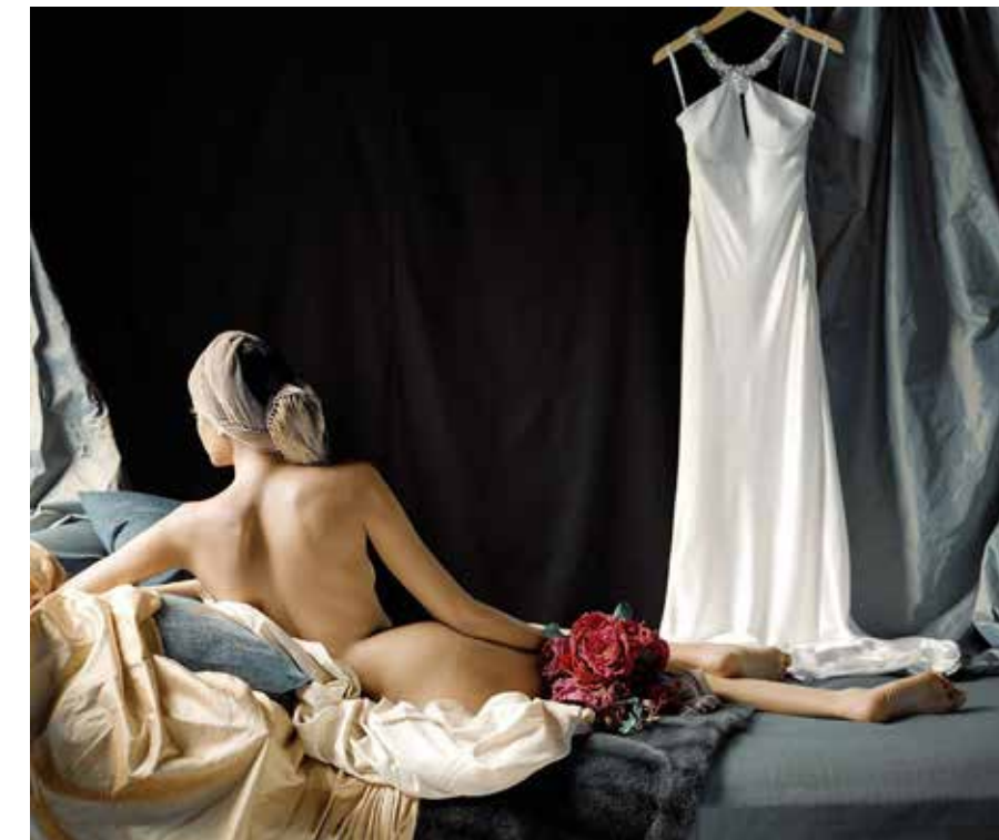
Rodney Smith | Odalisque No 1, Winfield Estate, Long Island | 2004

Photo London 2024 priniesol obrazy zo 44 miest na štyroch kontinentoch, predstavujúc dôležité diela od počiatkov média až po súčasnosť. Tohtoročný festival predstavil aj sólovú výstavu fantastickú kariéry Davida Baileya.