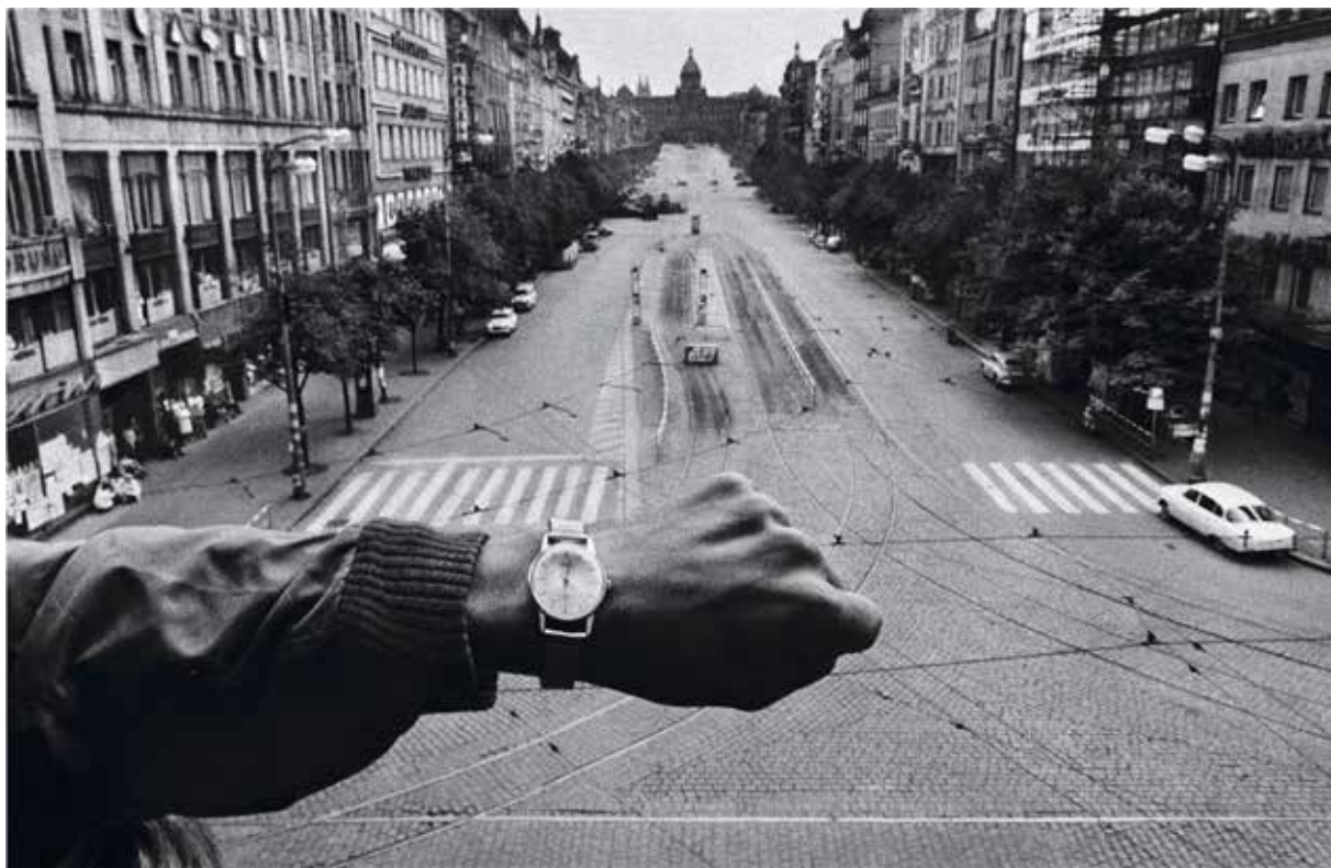
Josef Koudelka | Magnum Photos | Praha | srpen 1968

Spisovatelka však umělcův příběh rekapituluje netoliko z vnější stránky, nýbrž také co do motivací. „Koudelkova podstata vychází z jeho obsesivního ponoření do života,“ předesílá hned v první kapitole. „Zredukovat ho na pouhou legendu by znamenalo uvažovat o něm jako o konstruktu, o povrchu člověka. Pro něj je příhodné, že tato nálepka mu umožňuje nic neodhalovat.“