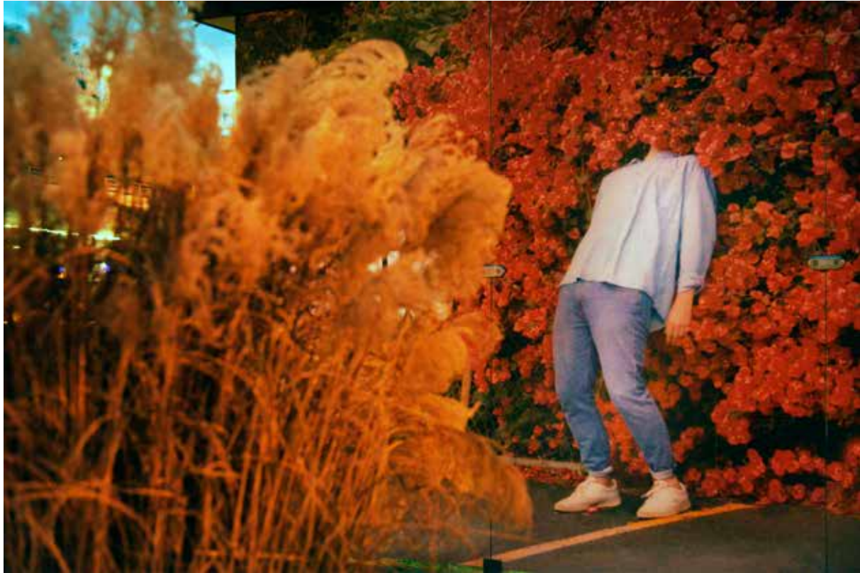
Vedľajší produkt 17

Každý realistický múzejník vie, že všetky zbierkové predmety sú určené na zánik. Otázkou je len to, kedy príde. Môžeme to len odlaďovať. No múzėa čelia ešte aj iným výzvam. Počty zbierkových predmetov rastú, samotná evidencia a inventarizácia sa stávajú náročnou výzvov. Ved napríklad jedna z najprestížnejších svetových pamätových inštitúcií – Britské múzeum – vlní oznámila, že jej chýba okolo 2 000 zbierkových predmetov. Ešte horšie je to s prírodovednými zbierkami, keď prirodzené procesy rozkladu sú intenzívnejším ohrozením než zlodeji a obchodníci s umením. Iným aktuálnym problémom je nezriedka problematický pôvod zbierkových predmetov či už z hľadiska etického,