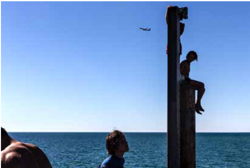
Vladimír Birgus | Glenelg | 2016

dominantní barvy přispívají k tomu, že snímky získávají nereálné prvky, které připomínají spíše abstraktní malířství než nemanipulovaný obraz skutečnosti. Stále zřetelnější je postupný posun od sociálně orientovaných témat k výrazně subjektivnímu pojetí dokumentu. Rafinovanost zobrazení je výsledkem autorova osobitého pohledu na nemanipulovanou skutečnost. Vladimír Birgus nearanžuje a společá na objevování přízračných okamžiků zdánlivě obyčejných scén, v nichž se spojuje reálno se surreálnem. V mnohých konfrontacích lidí s prostředím či v reakci na různé koexistující příběhy autor cizeluje mikropříběhy lidského bytí. Sevřený děj se tím otevírá do významově širších obrazových plánů a světelná atmosféra umocňuje celkovou kompozici. Sledujeme-li subjektivní obrazy Vladimíra Birguse, čteme zároveň příběh o současné globalizované společnosti, o samotě uprostřed davů i o vlastních autorových pocitech. Rafinovanost zobrazovaných dějů je výsledkem pohledu na nemanipulovanou skutečnost.