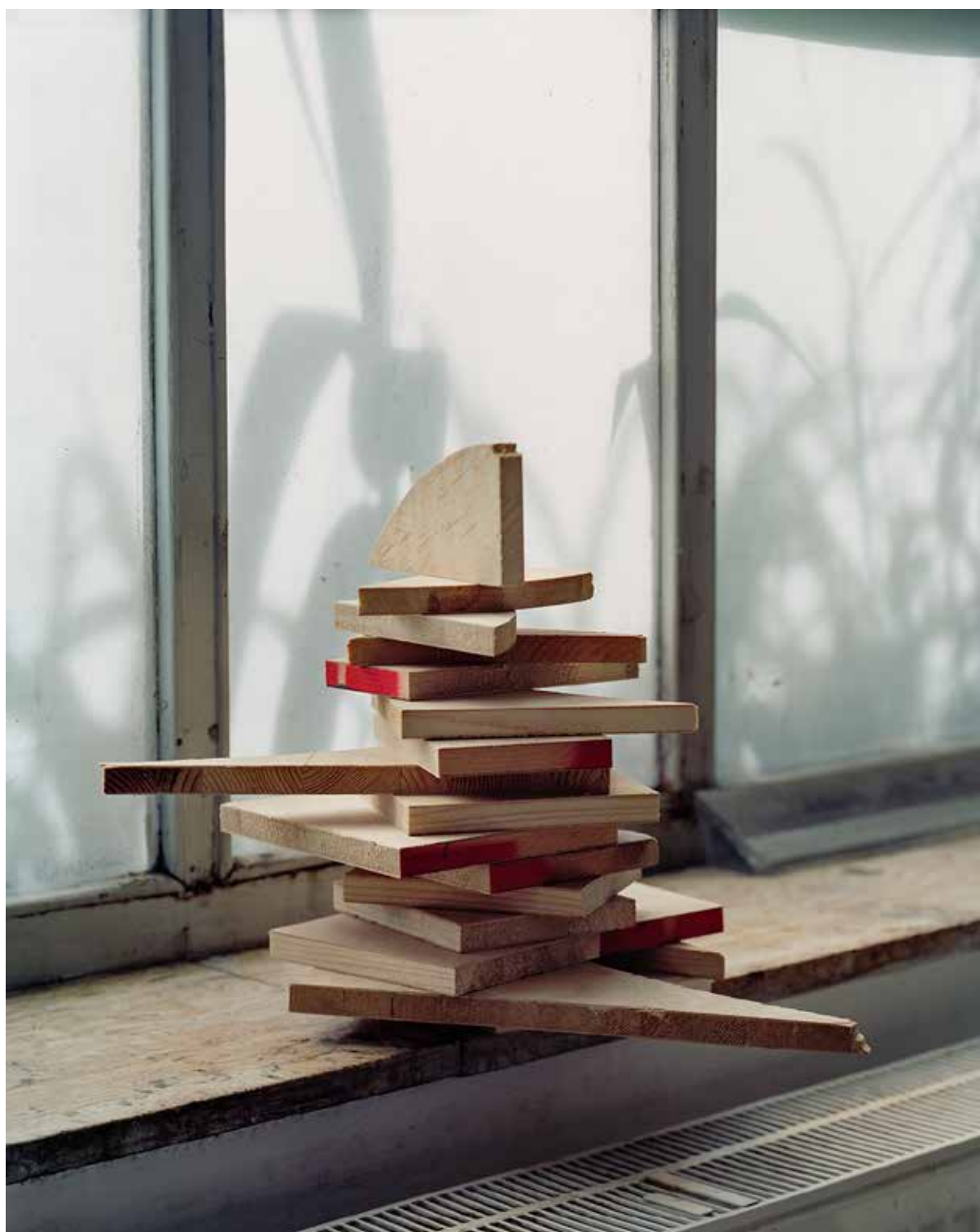
Ján Kekeli | Bez názvu zo série Plávajúca podlaha | 2021