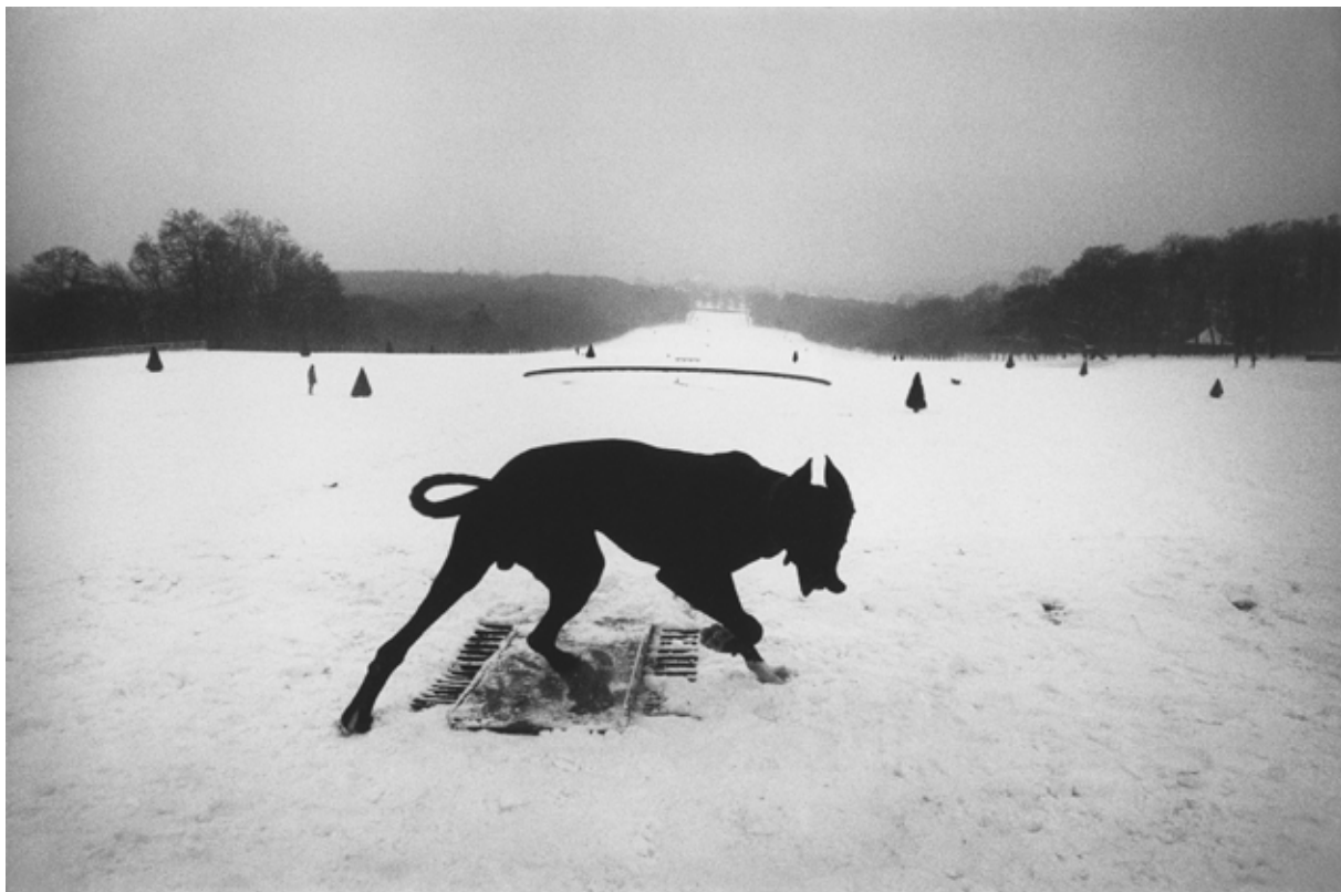
Josef Koudelka | Magnum Photos | Francie | 1987