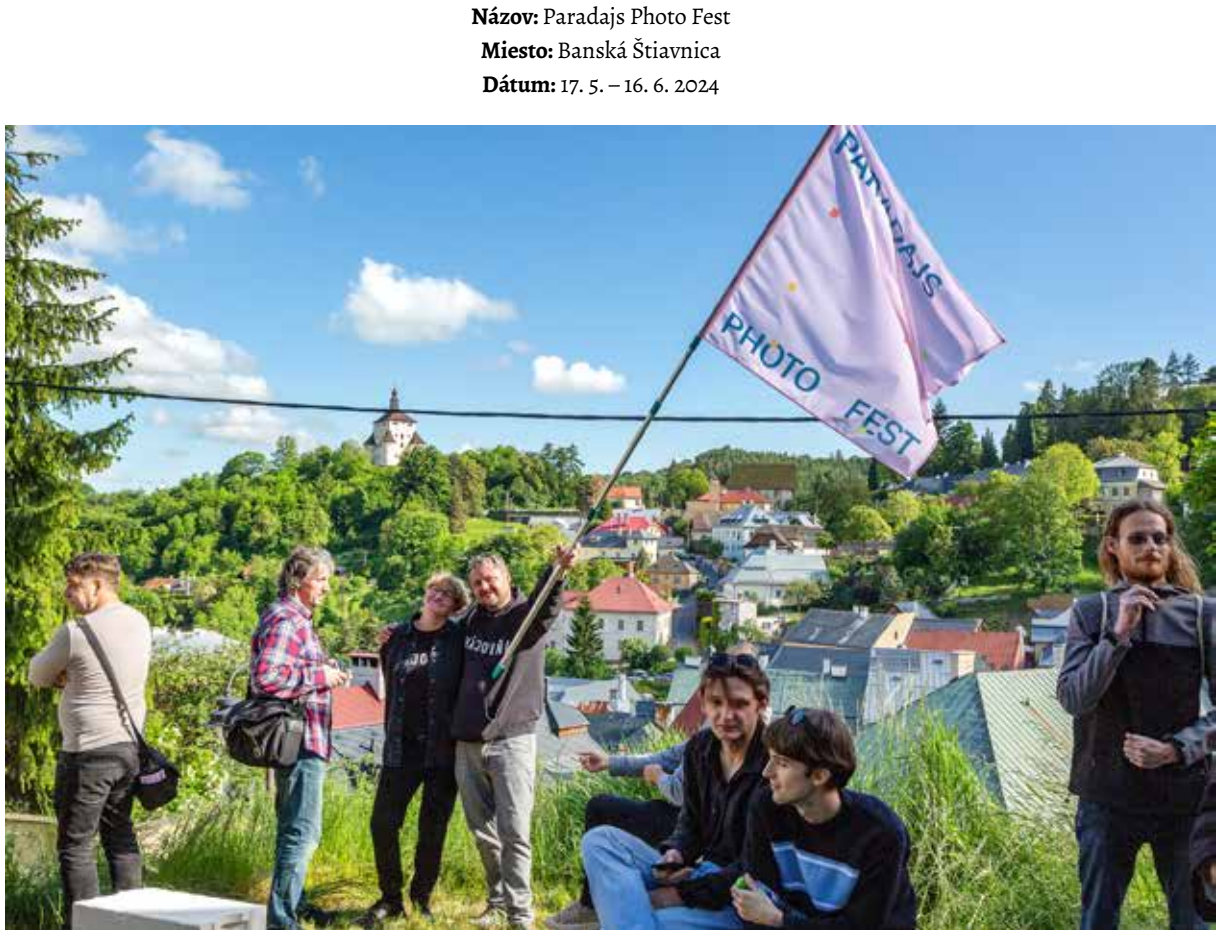
Paradajs Photo Fest