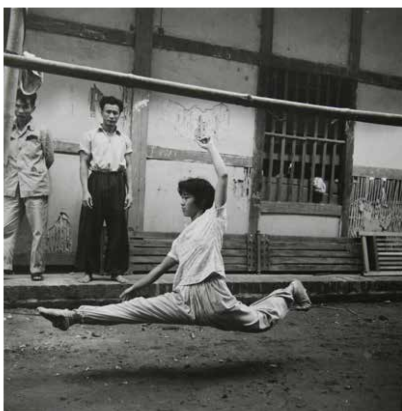
Bez názvu | z cyklu Vietnam | 1961

pretože som si bola istá, že nikto z českých a slovenských fotografiek či fotografov nebol jej súčasťou. Podtrhuje však fakt, že Hochovej práca rezonuje s duchom a odkazom humanistickej fotografie a výstavy „The Family of Man“, pretože aj Dagmar Hochová zachytávala univerzálne aspekty ľudského života prostredníctvom svojho citlivého a empatického objektívu.