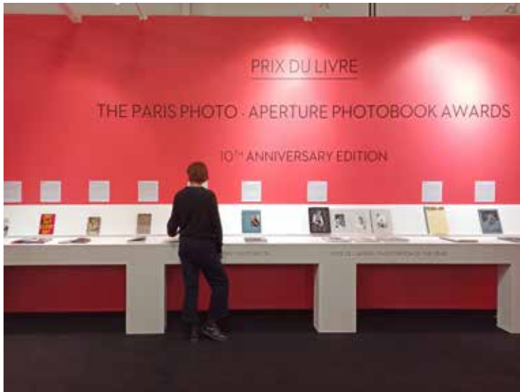
Paris Photo Aperture Photobook Awards 2022