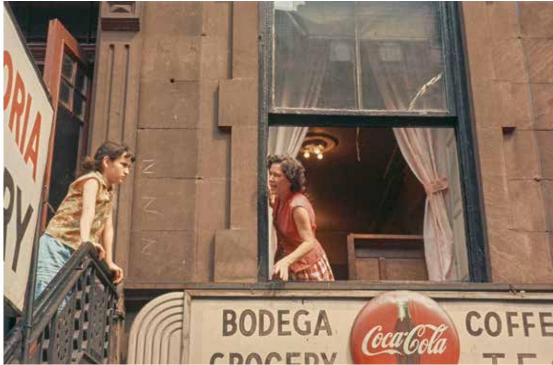
Helen Levitt | New York | 1988

Miesto: Somerset House, Londýn, Veľká Británia