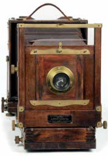
Cestovný prístroj anglického typu na dosky formátu 9 x 12 cm Eastman View Camera No. 2-D, 1921

Princíp vyvolania priestorovej ilúzie prostredníctvom dvojice susediacich obrázkov bol známy už pred vynájdением fotografie. Prvé stereoskopické dagerotypie pochádzajú z roku 1844 a boli vytvárané tak, že po prvej snímke sa prístroj posunul približne o vzdialenosť očí a bola zhotovená druhá snímka. Pri pozorovaní dvojice takýchto obrazov pomocou