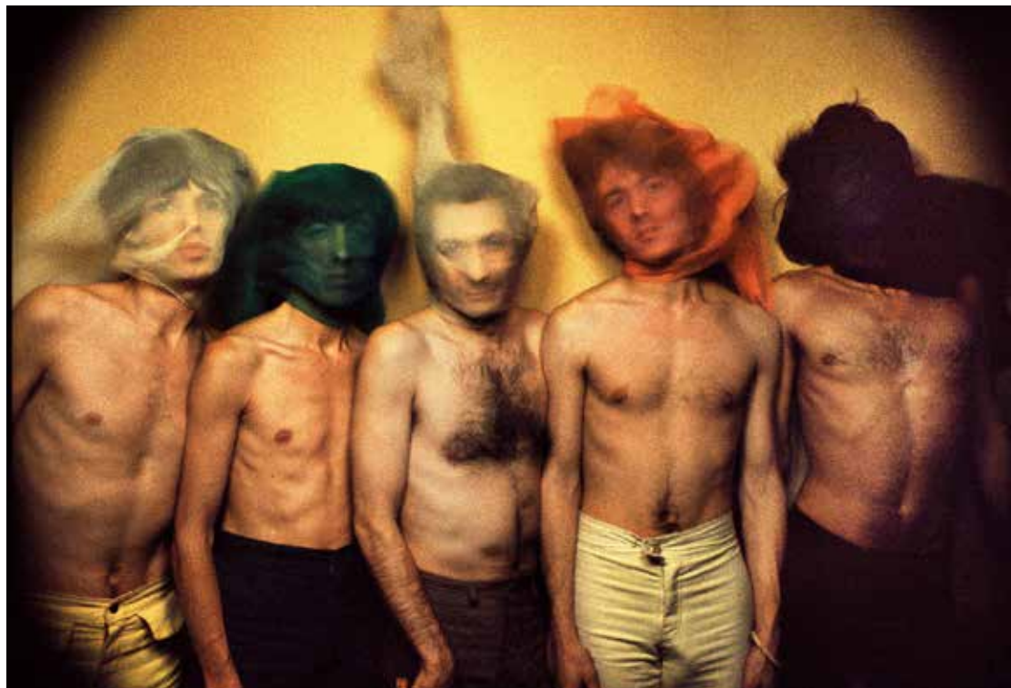
David Bailey | Rolling Stones, Goats Head Soup | 1973