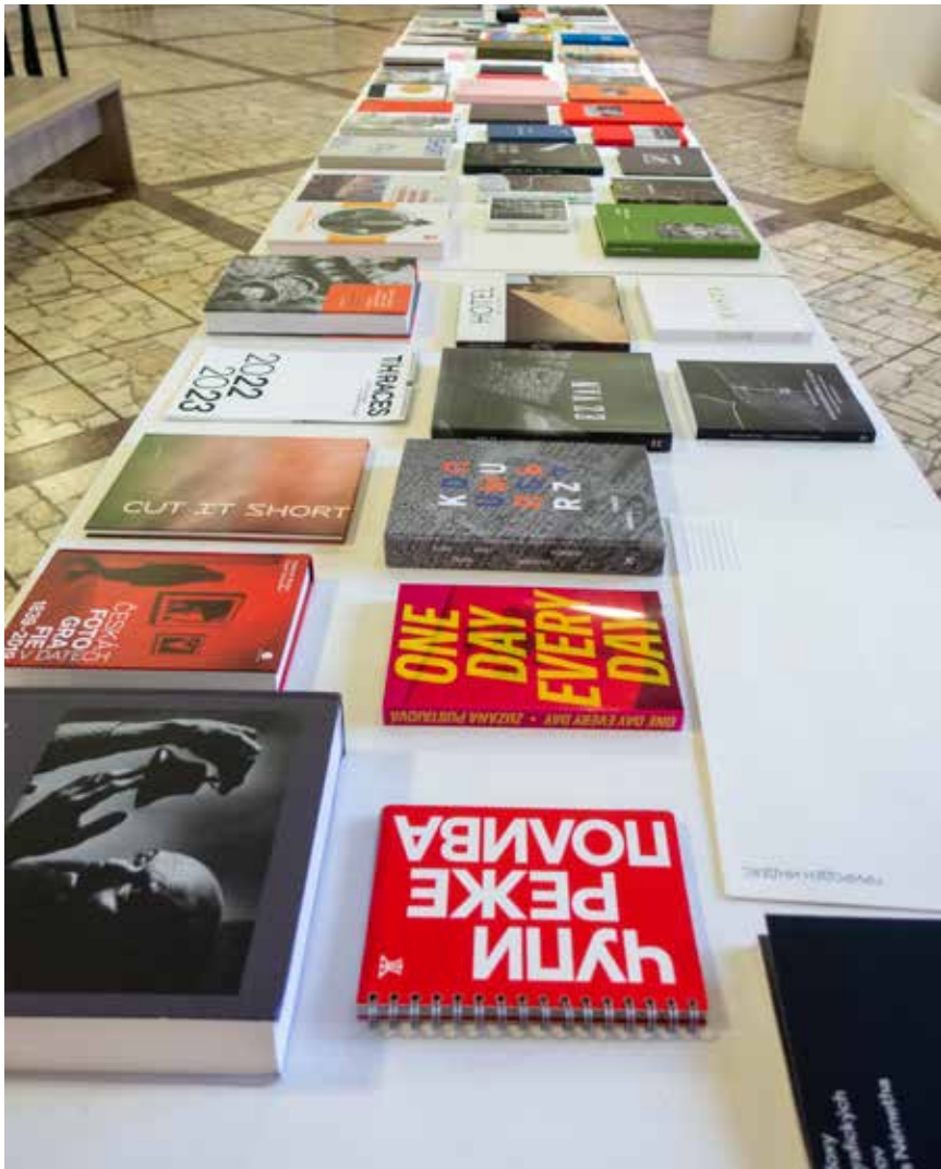
Súťaž fotografických kníh | Mesiac fotografie v Bratislave 2022

História súťaže siaha do prvých rokov druhého milénia. Prvé zmienky o súťaži máme už hneď v roku 2000, pričom prvé víťazné publikácie sú známe od r. 2002. V prvých rokoch sa ešte nesťahovalo v kategóriách, ale od polovice nultých rokov už sa udomácnilo súťaženie v dvoch kategóriách, a to Historická fotografia a Súčasná fotografia, pričom v každej kategórii sú udeľované prvé tri miesta. Okrem toho môžu byť udeľené aj čestné uznania v oboch kategóriách. Ustálil sa priebežne aj medzinárodný charakter zloženia poroty, ktorá pozostáva z troch členov. V r. 2021 sa konala pri príležitosti 10. výročia súťaže a ubehnutia dvadsiatich rokov od prvého ročníka veľká jubilejná výstav s názvom 100 najlepších fotografických kníh v strednej a východnej Európe 2000 – 2020, kde boli okrem publikácií navrhnutých takmer dvadsiatkou odborníkov v oblasti fotografie zo Slovenska, Česka, Rakúska, Poľska, Ukrajiny, Maďarska, Fínska, Ruska, Slovinska, Litvy, Estónska, Bieloruska a Srbska do špeciálnej sekcie zaradené aj všetky knihy, ktoré v uplynulých desiatich ročníkoch zvíťazili v súťaži.