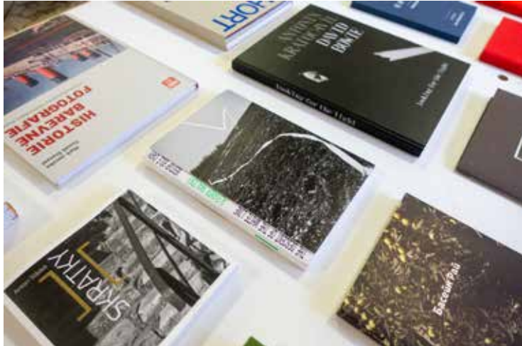
Súťaž fotografických kníh | Mesiac fotografie v Bratislave 2022