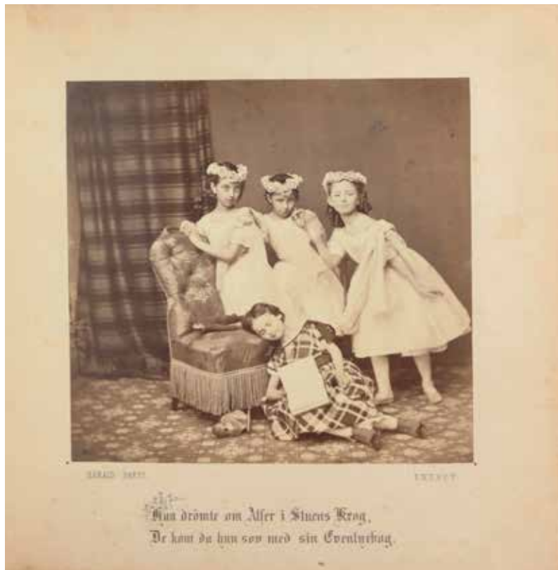
3. Harald Paetz (fotografie), Hans-Christian Andersen (text), Fotograferede Børnegrupper. Kodaň 1866.

V rámci Photobook Week Aarhus 2023 sme dostali príležitosť kurátorovať výstavu venovanú tejto téme v spolupráci s Múzeom súčasného umenia HEART v Herningu. Pod názvom „For Kids Only?! Exploring Photobooks for Children“ (Len pre deti?! Skúmanie fotokníh pre deti) sme vybrali o niečo menej ako 100 kníh z rôznych krajín, ktoré boli publikované v priebehu rokov. 2