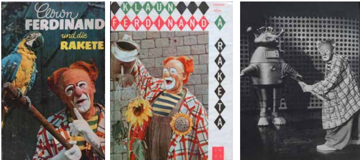
Oto Hofmann (text) a Miroslav Pesan (fotografie): Klaun Ferdinand a raketa (1965). Zo súkromnej zbierky Thomasa Wieganda.

kolážami, ktoré zaujímavo kombinujú kresby s fotografiami.