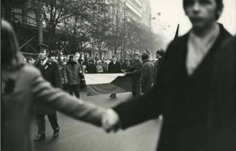
Pohřeb Jana Palacha | Praha | leden 1969

radosti, smútku a úvah poskytuje pohľad do životov jednotlivcov, ktorí sa pohybujú v zložitom sociálno-politickom prostredí.