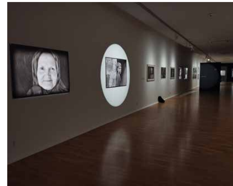
Z výstavy Vidieť. Cítiť. Zaznamenať. Vo Východoslovenskej galérii

ho osobne nestretla – neviem si to už odmyslieť, ale myslím, že, odhladiac od všetkého mysteriózneho v súvislosti s jeho osobnosťou, je pár objektívnych zvláštností, ktoré kurátori výstavy Zuzana Labudová a Miroslav Kleban v koncepcii a architektúre výstavy mimoriadne dobre vystihli. Ide najmä o koncepciu, ktorá neprezentuje tému, motív alebo nejaký autorov projekt, ale jeho „vidieť, cítiť, zaznamenať“, ako to vyjadruje aj názov výstavy. Táto pre výstavy netypická antitematickosť