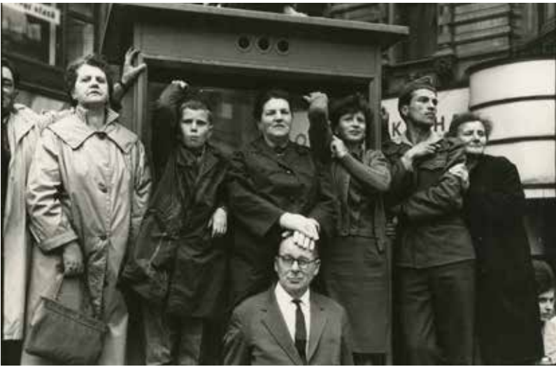
Diváci na Václavském náměstí přihlížejí spartakiádnímu průvodu | Praha | 1965